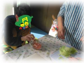
个丁寧に玉ねぎの皮をむく中学生

今日のめあて「子どもたち、ボランティアさん、親御さん、職員がお互いのことを思って楽しめるクリスマス会にする。」 を朝の会で確認して、早速クッキング！