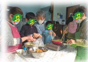
个幼児たちもできることは積極的に取り組んでいます。